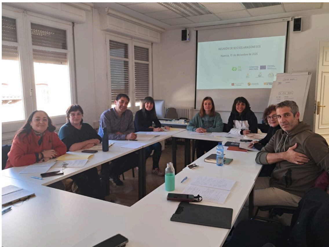
Reunión de trabajo en Huesca. 11 de diciembre de 2025

EKO – Pirineos de Circo es un proyecto europeo de cooperación transfronteriza cofinanciado por el #FEDER y el programa Interreg-POCTEFA