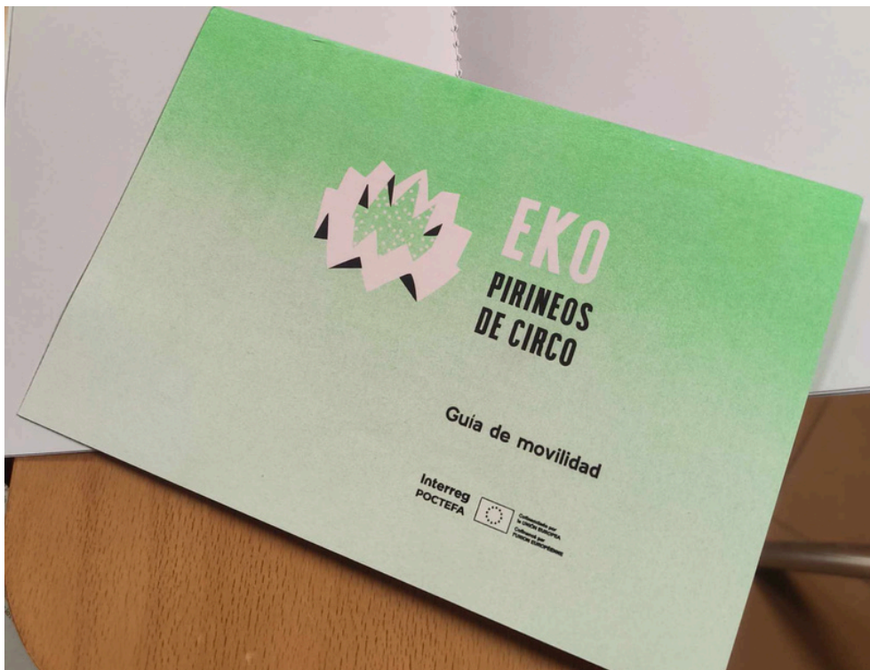
Sesión formativa en Zaragoza. 9 de julio de 2025