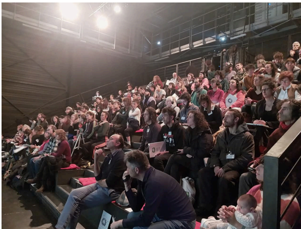
Sesión de trabajo en el auditorio de La Grainerie (Toulouse)