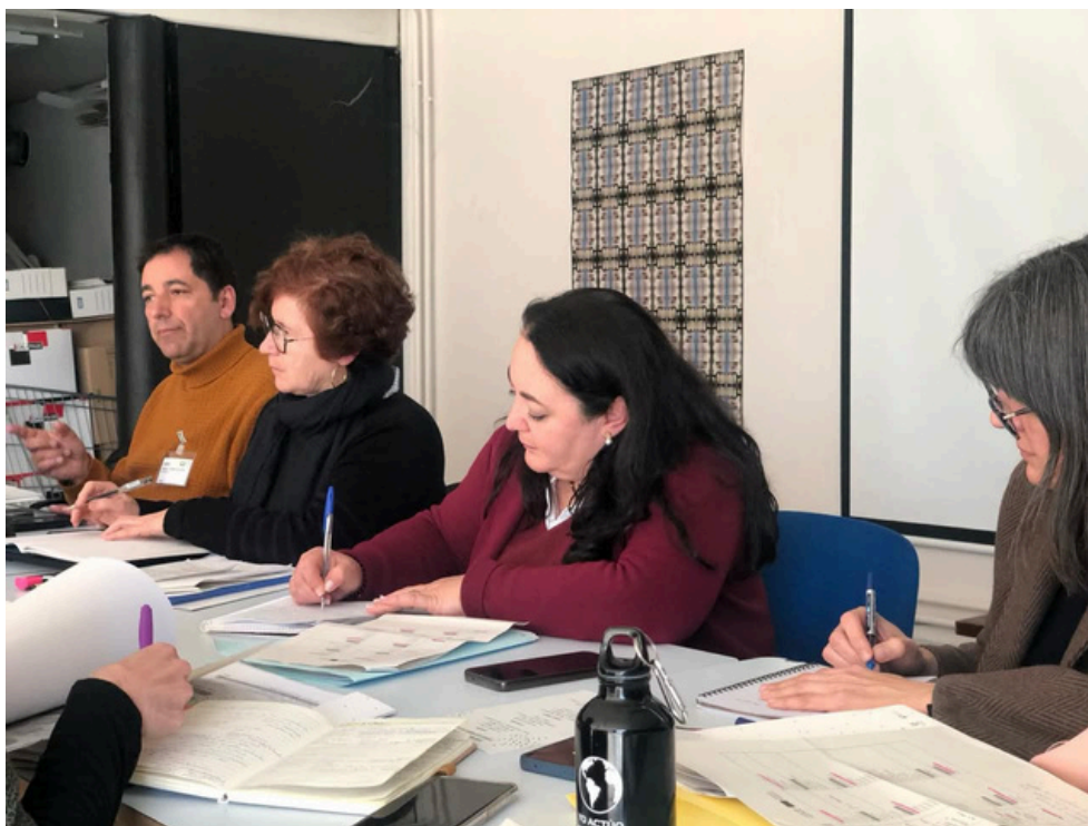
Reunión de trabajo en Toulouse