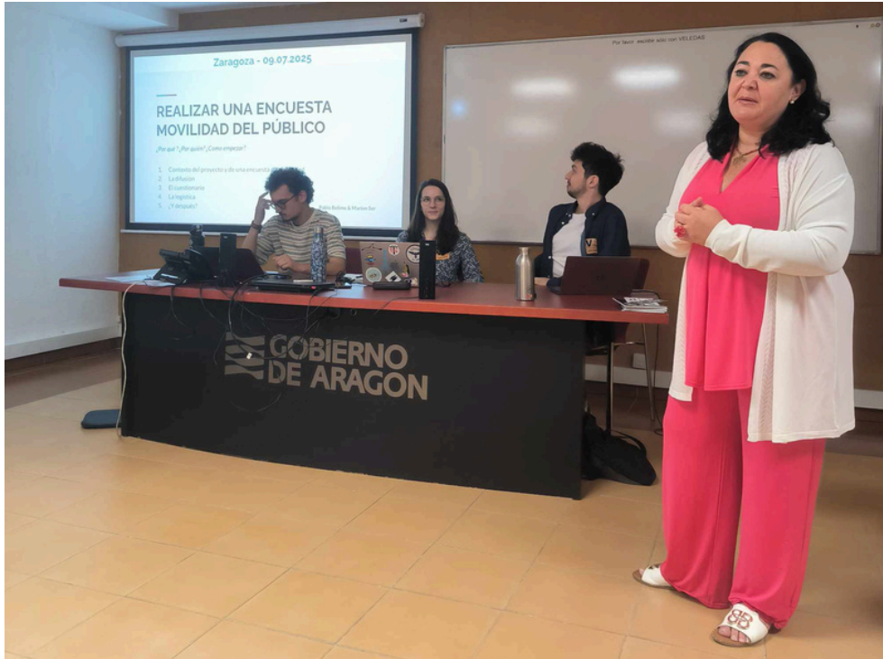
Sesión formativa en Zaragoza. 9 de julio de 2025