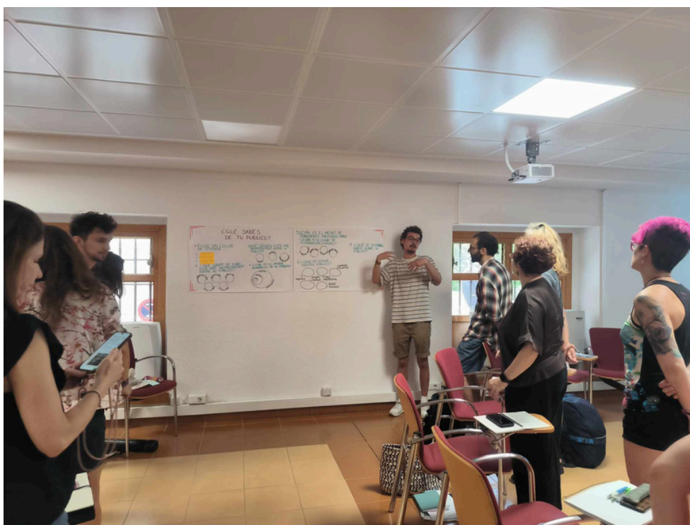
Sesión formativa en Zaragoza. 9 de julio de 2025

El jueves, 11 de diciembre, representantes de todos los socios y asociados de Aragón, así como de la mentoría del proyecto Eko, nos reunimos en Huesca para hacer balance de lo realizado este año y abordar de forma conjunta las acciones relacionadas con programación y formación, a realizar en 2026 y 2027.