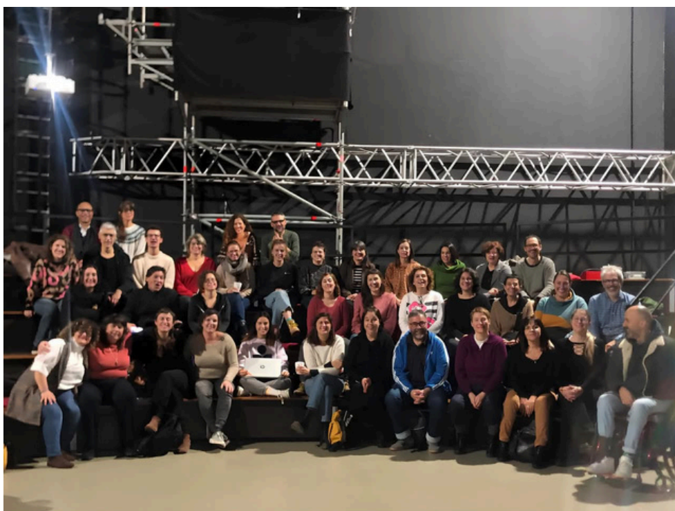
Participantes de la reunión en Barcelona