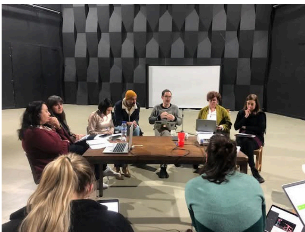
Reunión del equipo Aragón en Barcelona