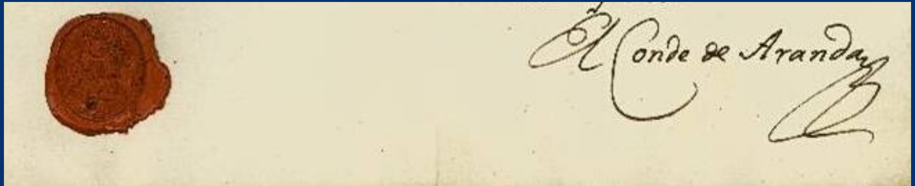
Sello heráldico y firma del conde de Aranda en un documento privado

En la documentación de la Real Audiencia de Aragón hay muchos expedientes sobre las epidemias que asolaron a los aragoneses del antiguo reino y las medidas que se fueron tomando por las autoridades locales, los alcaldes y el gobierno central, desde Madrid.